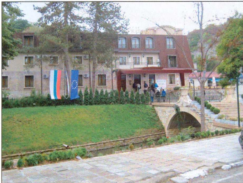
Hotel Kaylaka, het Congres-hotel