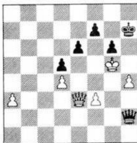
Diagram 11 uit Tijakov-Arbakov, Belgorod 1989 is een simpele, maar aardige opgave: „hoe wint wit in een zet“? Het antwoord luidt 1.a3!! en zwart loopt mat 1...Db3: 2.Dc5 + Kg8 3.Dg5 + Kf8 4.Dg7 + Ke8 5.Dg8 mat.