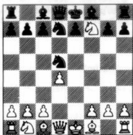
na 6. Pe5xf7

Na 1. e4 Pf6 2. e5 Pd5 3. d4 d6 4. Pf3 de5: 5. Pe5: Pd7!?