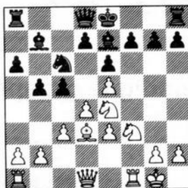
na 11. Pd2-e4

8. fe3:, c5 9. Pbd2, Le7 10. c3, Pc6 11. Pe4