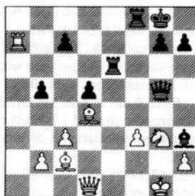
ma 23e zet wit Ta7!?

In deze partij zorgt wit voor een nieuwtje op de 23e zet in de Dilworth-variant van het Spaans die niet wordt genoemd door A.C. van der Tak in jaarboek 16 New In Chess.