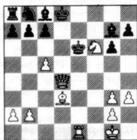
na 30. De3-d4!

11. c5 + Kd7 12. Lf4!? De8 13. De6 + Kd8 14. De5 Dd7 15. Pc3 Pg4