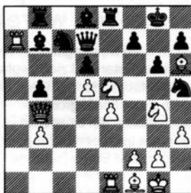
na 27. Pfxe5!!

(geboren uit noodzaak, maar zwart dreigde met f6 zijn vesting af te sluiten)