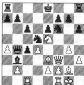
na 17. ..., Dd6-b4