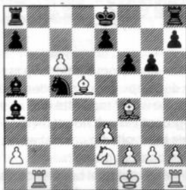
na 17. ..., f7f6?

Overziet, naar ik aanneem wit's antwoord.