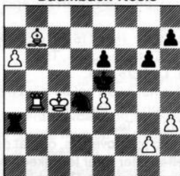
na 53. Ke4