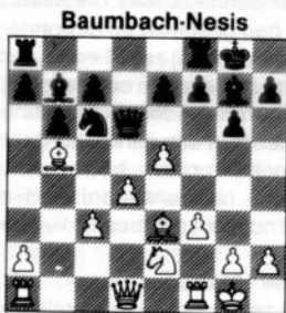
na 13. es

De dag voor Kerstmis gooide ik mijn kaart met deze zet in de brievenbus, zonder dat ik het mogelijke offer 13. ... Pe5: gezien had. 's Nachts om 2 uur werd ik wakker, dacht aan de partij en schrok: wat volgt er op 13. ... Pe5?: 14. de5: De5: met aanval op de beide lopers? Ik stond op, analyseerde tot de morgen, maar kon geen weerlegging vinden. Ik wist dat de kaart nog in de brievenbus lag,