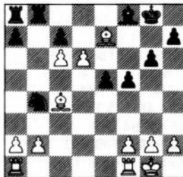
na 21. d6 +