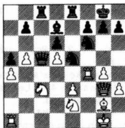
na 21. ..., Dc4-c5?