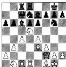
na 24. ..., Pc3-d5